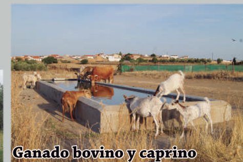
Ganado bovino y caprino

La trashumancia , desplazamiento semestral del ganado en busca de pastos y mejor clima, ha marcado profundamente el valle, generando puestos de trabajo, modelando el paisaje y dejando un legado cultural de importancia internacional. Entre los elementos que mejor representan la trashumancia en la comarca destacan las vías pecuarias, los chozos (viviendas de pastores), las ventas (alojamientos, restaurantes,...)