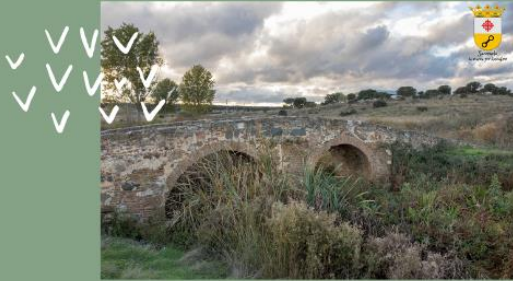
Puente Romano o de los Muertos (Siglos XII-XIV)

Puente construido entre los siglos XII-XIV por el Real Concejo de la Mesta, para el paso de ganado y contadero de la Orden de Calatrava, ubicado sobre la antigua vía romana de Toledo a Sevilla.