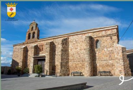
Iglesia Parroquial Ntra. Sra. de las Cruces Siglo XIII.

Su primera construcción data del siglo XIII, es el edificio actualmente más emblemático del pueblo. Ha sufrido muchas transformaciones, sobre todo después de la destrucción de las guerras carlistas. En la Actualidad se trata de un templo de una sola nave con muros de mampostería reforzados con contrafuertes. El interior de la nave se encuentra muy reformado. La puerta principal está enmarcada con arco apuntado y sobre ella se encuentra una espadaña de ladrillo.