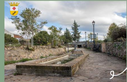
Pilar La Hontanilla - Siglo XII.

Al primer capítulo de la dicha relación que donde tuvo principio esta villa y llamarse Saceruela, dicen haber oído decir a sus antepasados más viejos, que esta tierra era yerma y que no había sino un colmenar donde ahora esta parte de la iglesia y que junto a una fuente que llaman "la Hontanilla" había un gran sauceral y que de ahí la llamaron Saceruela y que la dicha fuente es ahora gran servidumbre del Pueblo.