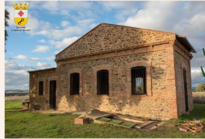
Campo de Aviación Año 1937.

Se trata de un aeródromo utilizado por aviación republicana durante la guerra civil, perteneciente al PRIMER Sector de la 5ª Región Aérea. El campo de aviación se construyó posiblemente a primeros del año 1937, estando operativo antes del verano del mismo año. El campo tenía una forma irregular, con una longitud máxima de 1.170 m por un ancho máximo de 1.031 m., y albergaba dos pistas que se cruzaban en X con unas longitudes de 1.430 m. y 1.200 m. adecuándolas a los vientos dominantes en la zona. La explanada estaba libre en todos sus accesos formando parte de la llanura que se extiende entre la Sierra del Capellan y Saceruela.